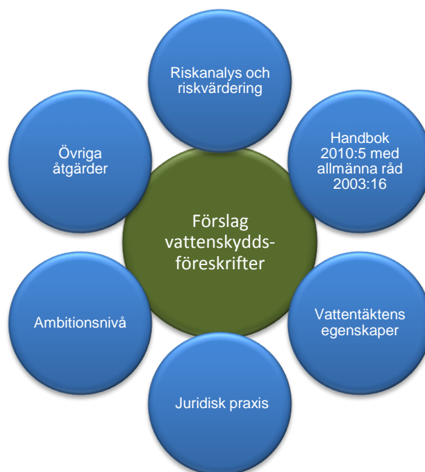
Figur 1: Resultatet från riskanalysen, tillsammans med den efterföljande riskvärderingen, är ett av flera underlag som används vid framtagandet av förslag till vattenskyddsföreskrifter

Förslaget till vattenskyddsföreskrifter är därtill resultat av en avvägning där den nytta vattentäkten erhåller med givna vattenskyddsföreskrifter sätts i relation till den uppoffring vattenskyddsföreskrifterna medför för dem som berörs. Vattenskyddsföreskrifterna ska bidra till att säkerställa nyttjandet av vattentäkten både nu och i framtiden men får samtidigt inte gå längre än vad som krävs för att uppnå detta.