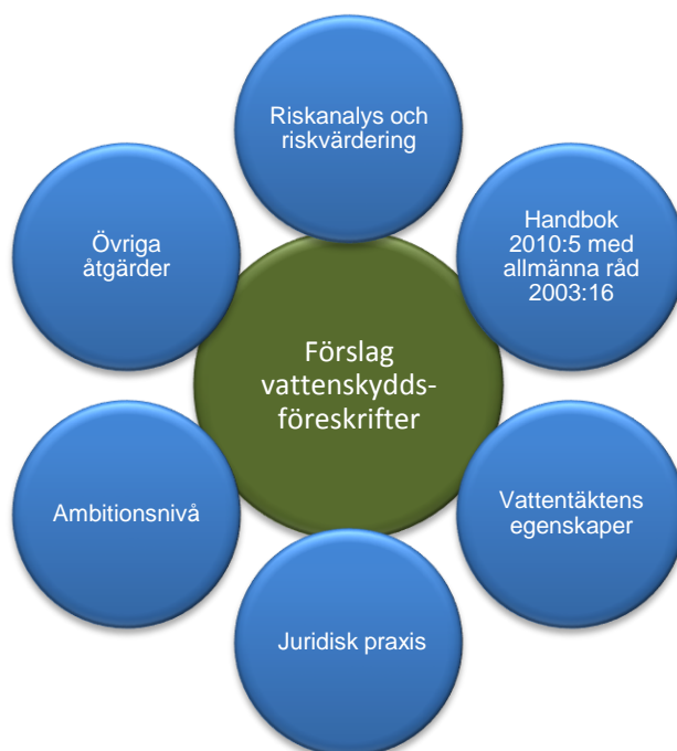
Figur 1: Resultatet från riskanalysen, tillsammans med den efterföljande riskvärderingen, är ett av flera underlag som används vid framtagandet av förslag till vattenskyddsföreskrifter

Förslaget till vattenskyddsföreskrifter är därtill resultat av en avvägning där den nytta vattentäkten erhåller med givna vattenskyddsföreskrifter sätts i relation till den uppoffring vattenskyddsföreskrifterna medför för dem som berörs. Vattenskyddsföreskrifterna ska bidra till att säkerställa nyttjandet av vattentäkten både nu och i framtiden men får samtidigt inte gå längre än vad som krävs för att uppnå detta.